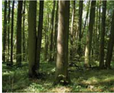
Rezerwat przyrody Baniska Las Lipowy Obrożyska