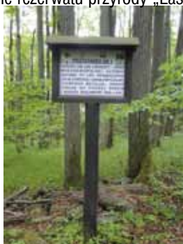
Tablica na ścieżce przyrodniczej w Obrożyskach

Ścieżka przyrodnicza zlokalizowana na terenie rezerwatu przyrody „Las Lipowy Obrożyska”, znajdującego się nieopodal Muszyny. Jest ona ogólnodostępna, dobrze oznaczona, a czas potrzebny na jej przejście to około 2,5 godziny. Na ścieżce wyznaczono 7 przystanków, na których znajdują się tablice dydaktyczne. Można się z nich dowiedzieć wielu ciekawych informacji na temat tutejszej przyrody, a w szczególności na temat typów siedlisk leśnych, typów drzewostanów i gatunków lasotwórczych. Opisane zostały między innymi: lipa drobnolistna, jodła, buk, grab, modrzew oraz inne gatunki drzew i roślin runa leśnego. Należy pamiętać, że ścieżka znajduje się na terenie rezerwatu przyrody i wolno tu poruszać się tylko po wyznaczonych trasach.