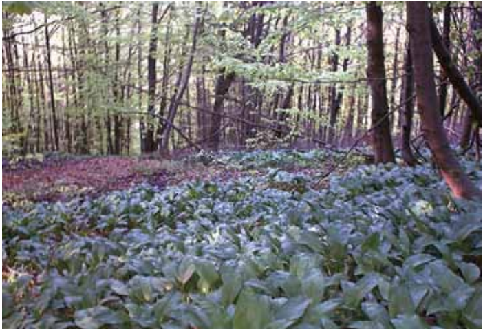
Łan czosnku niedźwiedziego