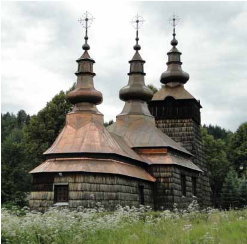
Cerkiew św. Dymitra w Szczawniku