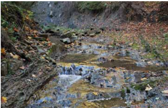
Skąły w Uhryńskim Potoku

z Łabowej. Wiek ich tworzenia oszacowano na 23-65 mln lat temu (okres paleogenu). SĄ one w tym rejonie bardzo mocno sfałdowane, niejednokrotnie o różnym kącie zapadania. Dodatkowo różny przebieg potoku powoduje, że warstwy skalne raz układają się równolegle do spływu wód, a kawałek dalej poprzecznie.