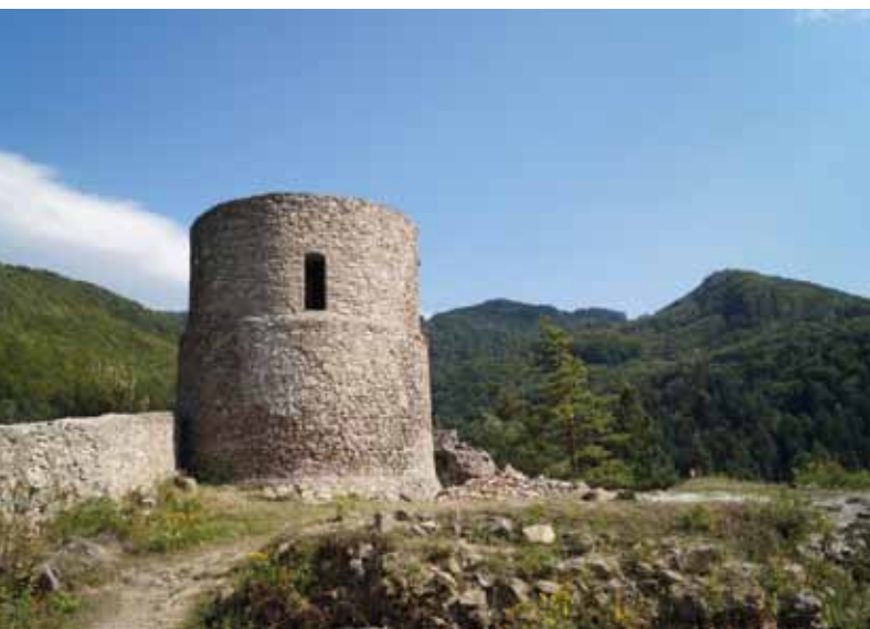
Ruiny zamku w Rytrze

Muzeum regionalne „Państwa Muszyńskiego”, mieści się w niewielkim dworku będącym rekonstrukcją zabytkowego, XVIII-wiecznego budynku, potocznie nazywanego „Zajazdem”. Znajduje się w nim ekspozycja poświęcona historii regionu.