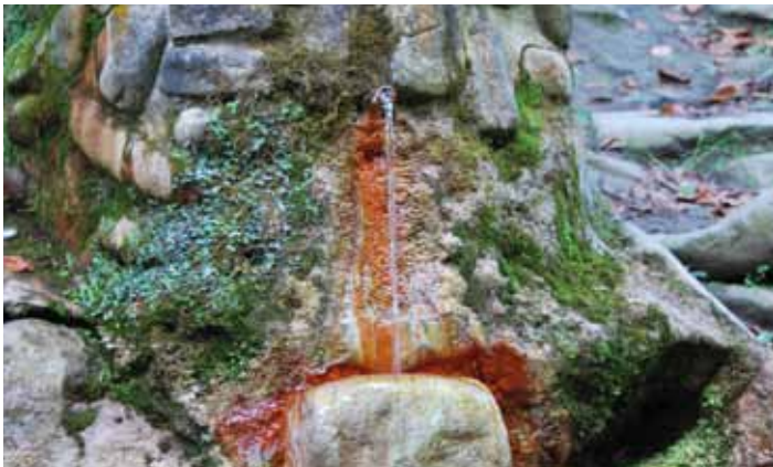
Źródło „Łomniczanka” w Łomnicy Zdroju