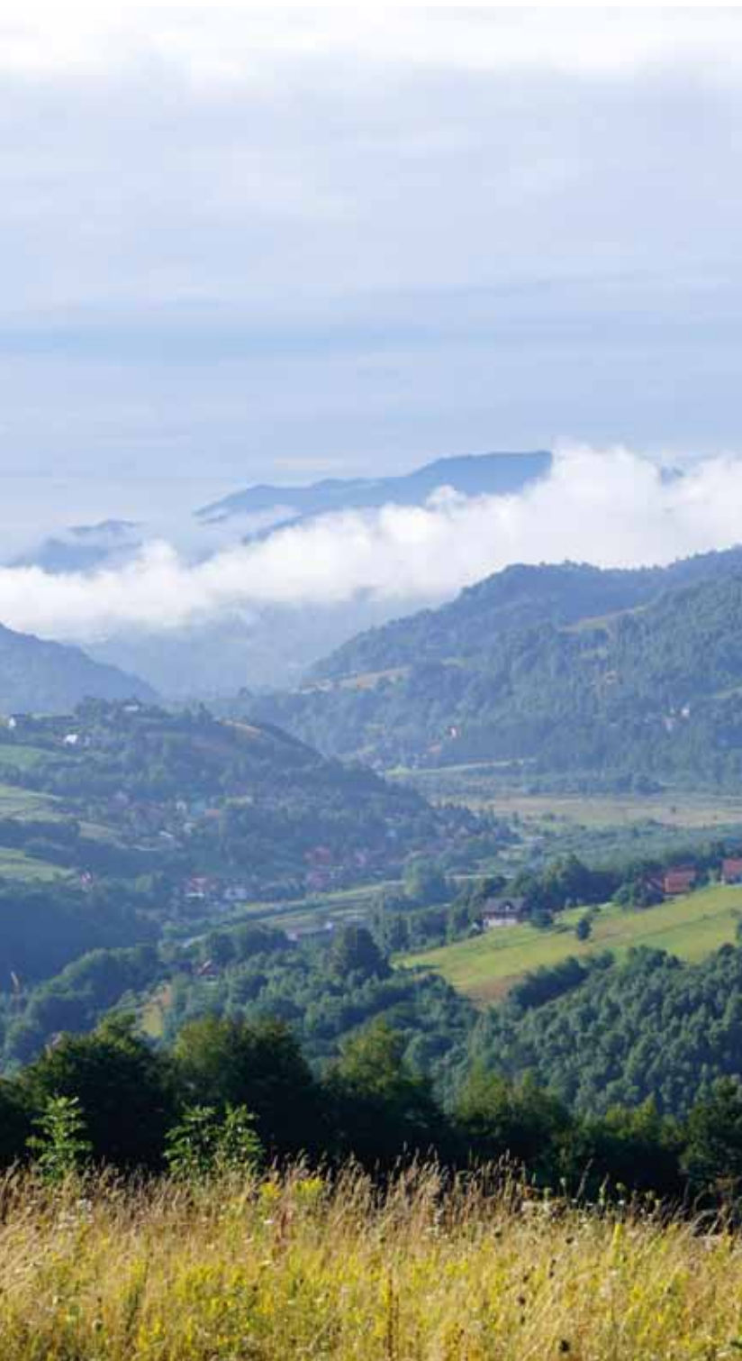
Krajobraz Beskidu Sąddeckiego