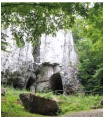
Wejście do Jaskini Nietoperzowej

Licznie występują w niej różne formy szaty naciekowej. Panuje tu typowy dla jaskiń mikroklimat – temperatura wynosi około 7,5 °C, a wilgotność waha się pomiędzy 90 a 98%. W jaskini można spotkać nietoperze oraz typowego dla takich miejsc pająka – sieciarza jaskiniowego. Jaskinia przystosowana jest do ruchu turystycznego, oświetlona, a jej zwiedzanie odbywa się z wykwalifikowanym przewodnikiem. Długość trasy, poprowadzonej przez najciekawsze korytarze i sale wynosi 700 m. Czas zwiedzania to około 1 h. Więcej informacji na: www.jaskiniawierchowska.pl