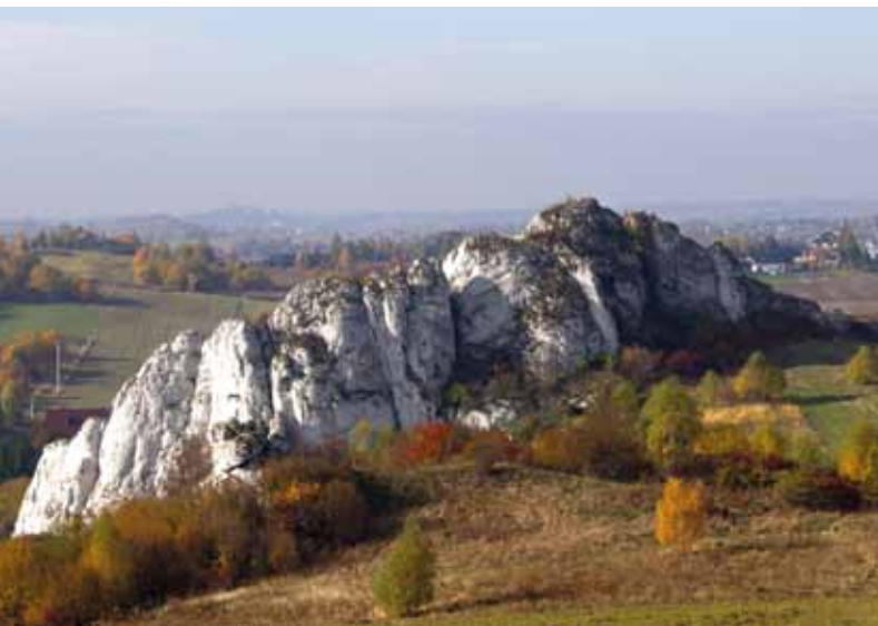
Ostańce skalne w Jerzmanowicach

Podłoże Parku ma dość skomplikowaną budowę, na którą składa się kilka różnowiekowych formacji. Najbardziej rozpowszechnionymi skałami, widocznymi na powierzchni terenu, są biało-szare wapienie górnourajskie, powstałe około 160 mln lat temu w morzu, które zajmowało w tym czasie między innymi teren dzisiejszego Parku. To właśnie te wapienie tworzą fantastyczne formy skalne, znajdujące się w większości dolinek oraz na płaskowyżu w okolicy Jerzmanowic. Jednak w wielu miejscach odsłaniają się skały dużo starsze. Są nimi wapienie dewońskie i karbońskie liczące około 390–310 mln lat. Zobaczyć je można w Dębniku czy Dolinie Raclawki. W Parku znajdziemy również jedną ze skał magmowych – porfir, odsłaniający się w nieczynnych kamieniołomach w Miękinii. Tworzenie się porfiru i innych skał magmowych było związane z przypadającą na okres permu (298–252 mln lat temu) dużą aktywnością wulkaniczną na terenie podkrakowskim. Na obszarze Parku występują również bardziej współczesne osady w postaci martwicy wapiennej, powstałej kilka tysięcy lat temu i znajdującej się między innymi w Dolinie Raclawki.