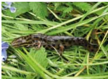
Samiec traszki zwyczajnej

Oprócz flory bardzo bogata na terenie Doliny Ractławki jest także fauna. Szczególnie ma to odzwierciedlenie wśród leśnych ptaków. Można tu zobaczyć np. pliszkę górską, puszczyka, kruka czy jastrzębia. Pisząc o faunie, nie sposób nie wspomnieć o występujących na tym terenie nietoperzach. Przedstawiciele kilku gatunków, między innymi podkowiec mały, nocek duży czy nocek orzęsiony, stanowią wyjątkową wartość przyrodniczą tego obszaru.