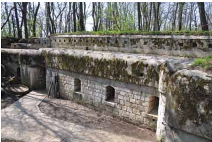
Fort w Toniach

Fort w Toniach – fort artyleryjski, pancerny, jeden z największych spośród fortów należących do systemu dawnej Twierdzy Kraków, powstały w latach 1874–1880, rozbudowany w 1910 roku. Obecnie mieści się tam Muzeum Twierdzy Kraków.