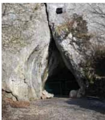
Wejście do Jaskini Wierchowskiej Górnej