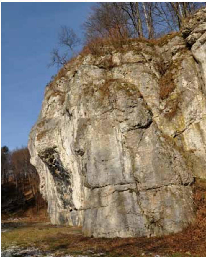
Skalka Dupa Słonia w Dolinie Będkowskiej

Obszar Parku położony jest na Wyżynie Olkuskiej, stanowiącej część Wyżyny Krakowsko-Częstochowskiej. Najbardziej charakterystycznymi formami ukształtowania terenu są tu głęboko wcięte dolinki o generalnym przebiegu północ – południe. Znajdziemy w nich strome ściany skalne i wijące się w dnie potoki. Ponad dolinami, na wierzchołkach, występują ostańce skalne – formy skałkowe przybierające różne ciekawe kształty. Część skałek posiada z tego powodu adekwatne nazwy: Dupa Słonia, Pytajnik, Czarcie Wrota, Kapucyn czy Żabi Koń. Warte zobaczenia są również jaskinie, licznie występujące w krasowym, wapiennym masywie skalnym. Powstały w skutek wyplukiwania przez wodę ze skał węgla wapnia, dzięki czemu utworzyły się przestrzenie