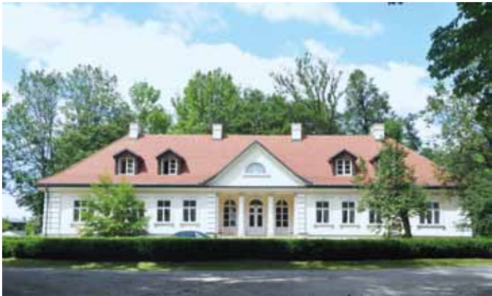
Dwór w Tomaszowicach