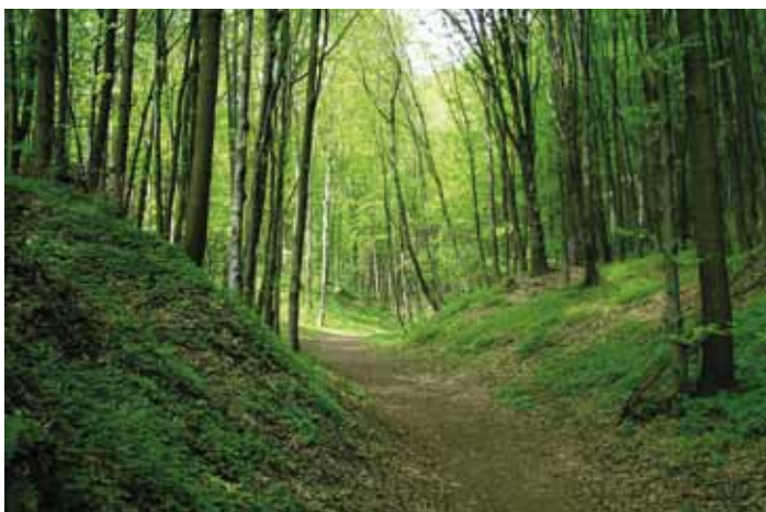
Rezerwat przyrody Dolina Raclawki

Jest jedną z kilkunastu podkrakowskich dolin, wyróżniającą się ogromnym bogactwem i różnorodnością przyrody ożywionej. Najcenniejsze, przyrodnicze walory tego terenu docenione i chronione są różnymi formami ochrony przyrody. Na tym niewielkim obszarze mamy nie tylko park krajobrazowy, ale także rezerwat przyrody i specjalny obszar ochrony siedlisk Natura 2000. A to wszystko dla ochrony między innymi bardzo cennych zespołów leśnych, siedlisk oraz rzadkich i chronionych gatunków flory i fauny polskiej. W obszarze rezerwatu występują niezwykle cenne starodrzewia, należące do sześciu zespołów leśnych.