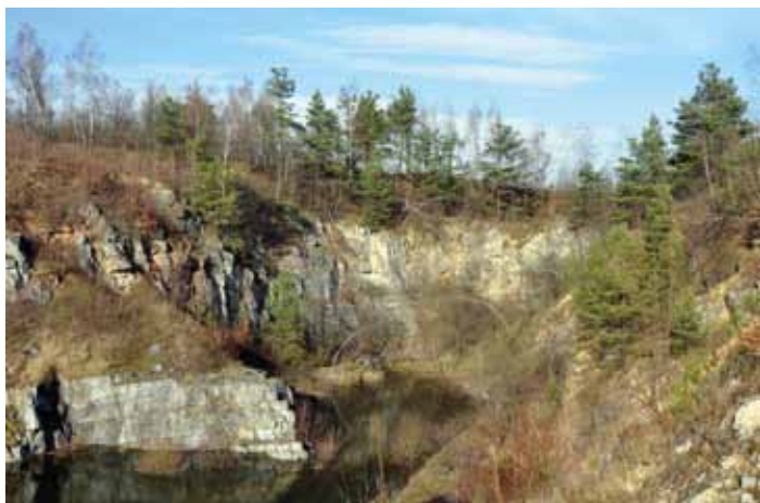
Łom Karmelitów w Dębniku

Dwa duże kamieniołomy dewońskiego wapienia dębnickiego, położone na północ od miejscowości Dębnik. Historia wydobywania w tym miejscu sięga XV wieku, a okres mody na jego wykorzystanie trwał od XVI do XVIII wieku. Przez wiele lat należał do Karmelitów Bosych z pobliskiego klasztoru w Czernej. Wydobywany w nich wapień, czarny po wypolerowaniu, stosowany był jako cenny materiał dekoracyjny w czasie epoki renesansu i baroku. Wykonane z niego ołtarze, portale czy inne detale można oglądać m.in. w Katedrze Wawelskiej, Kościele Mariackim w Krakowie, klasztorze Kamedułów na Bielanach, klasztorze Karmelitów Bosych w Czernej, klasztorze Paulinów na Jasnej Górze, warszawskim Zamku Królewskim, a także poza granicami Polski: w Salzburgu, Wilnie czy Kijowie.