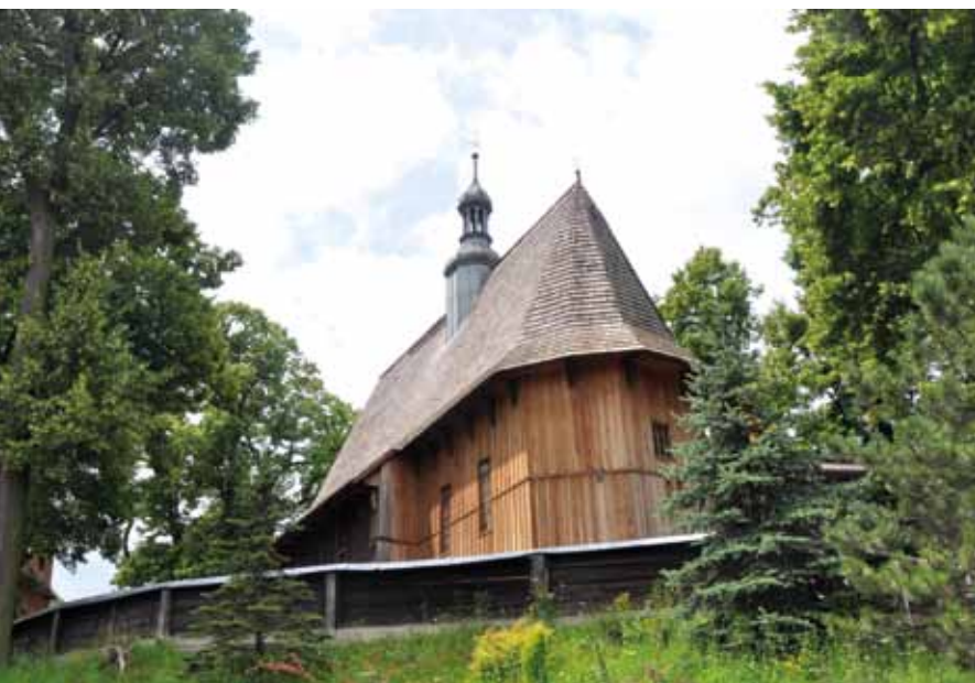
Kościół w Raclawicach