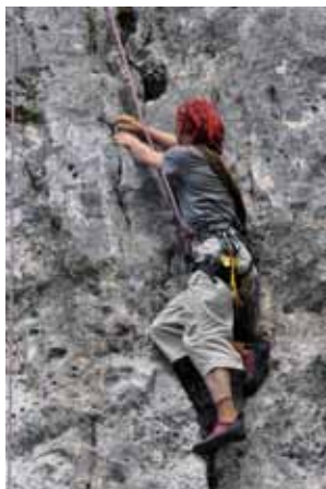
Wspinaczka skalna w Dolinie Bolechowickiej

Teren Parku jest wspaniałym obszarem do uprawiania tego typu aktywności. Ciekawą trasą może być okrężny odcinek Kobyłany – Dolina Kobyłańska – Będkowice – Dolina Będkowska – Kobyłany o długości około 8,5 km. W Parku oraz jego najbliższych okolicach odbywa się kilka dużych imprez biegowych, między innymi: Jurajski Półmaraton w Rudawie (czerwiec) oraz Bieg po Dolinie Będkowskiej (wrzesień).