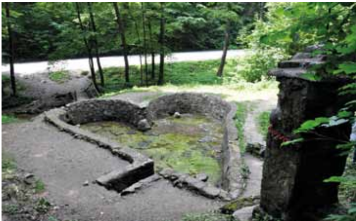
Źródło św. Eliasza